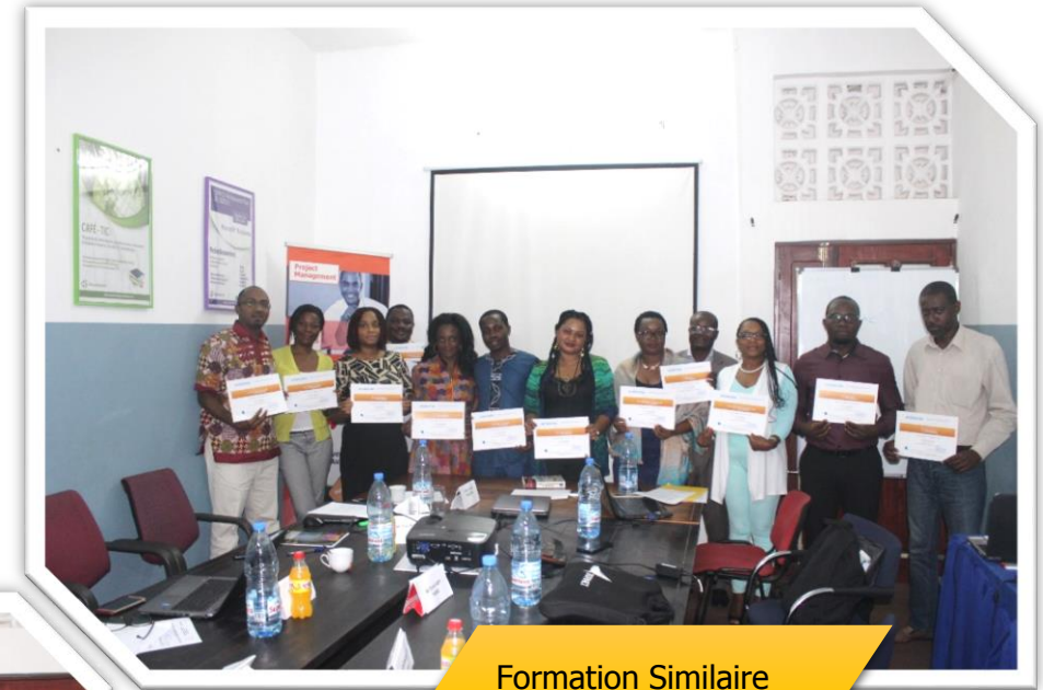
Formation Similaire IHS CAMEROON