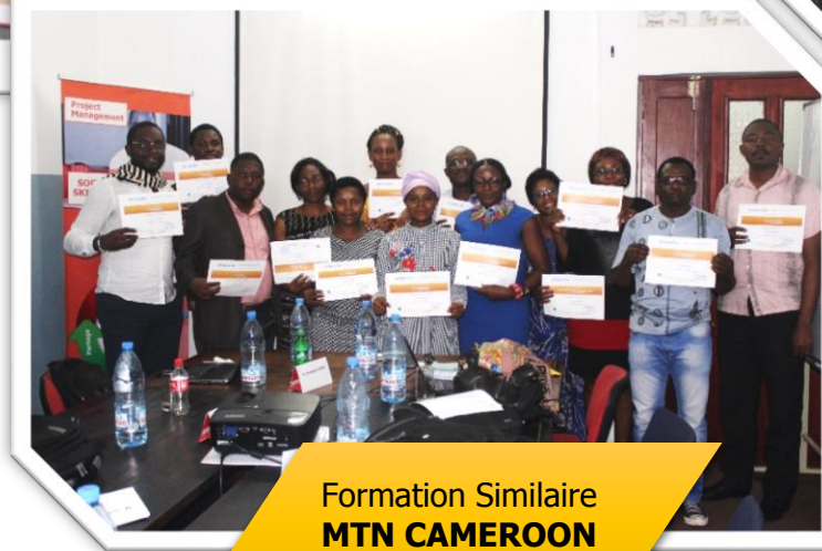
Formation Similaire MTN CAMEROON