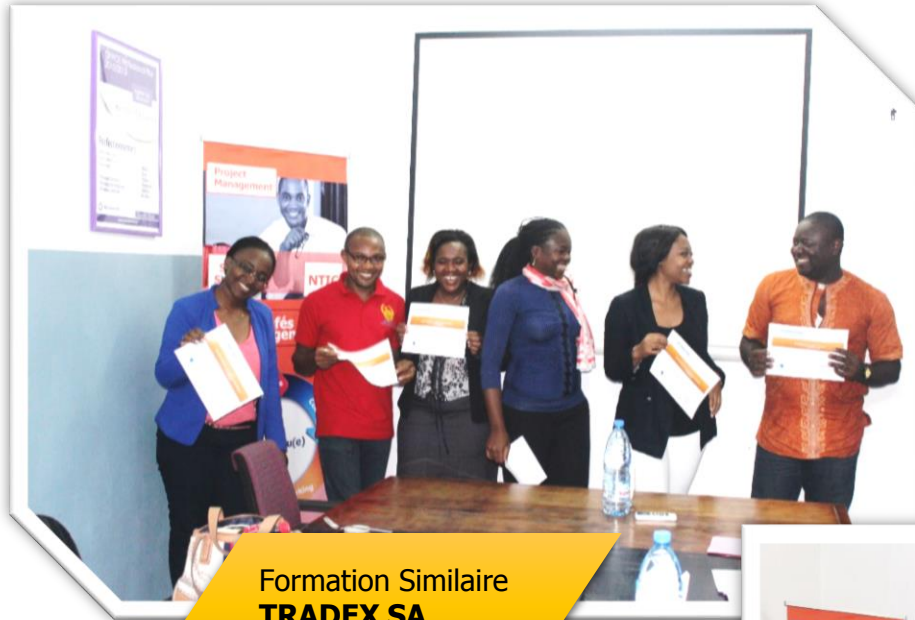
Formation Similaire TRADEX SA